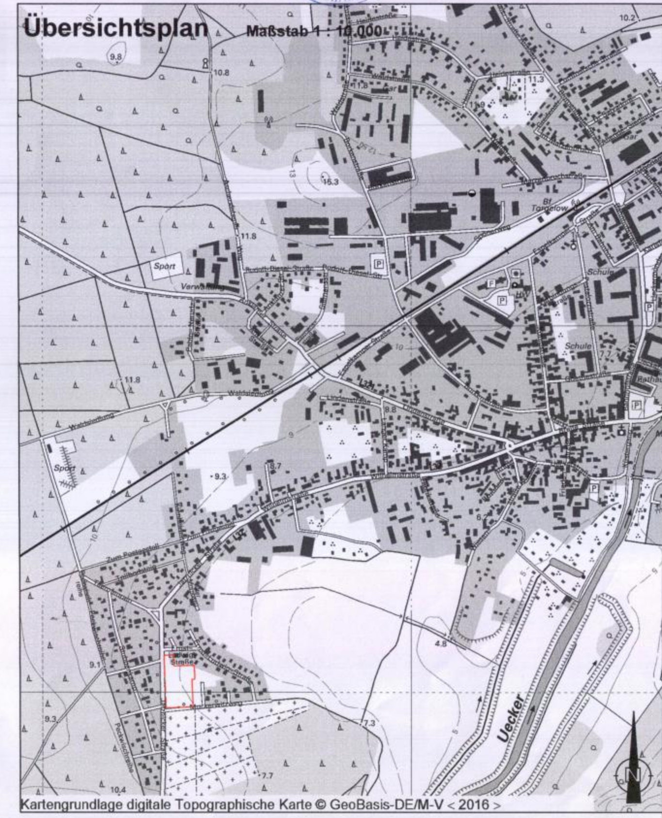
Kartengrundlage digitale Topographische Karte © GeoBasis-DEM-V < 2016 >