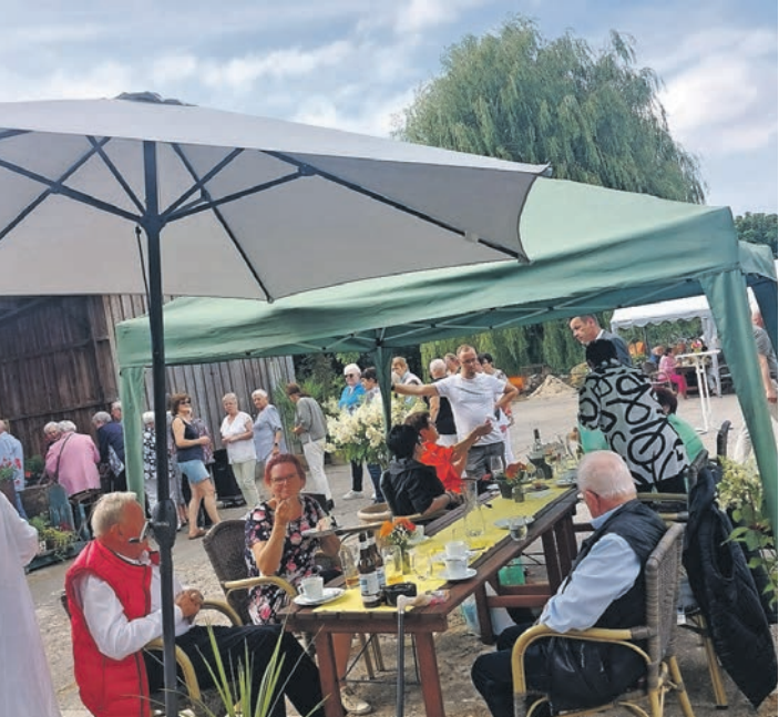
Ein gelungener Nachmittag für den Seniorenverein.

Schöner Nachmittag für Kreihnsdörper Seniorenverein