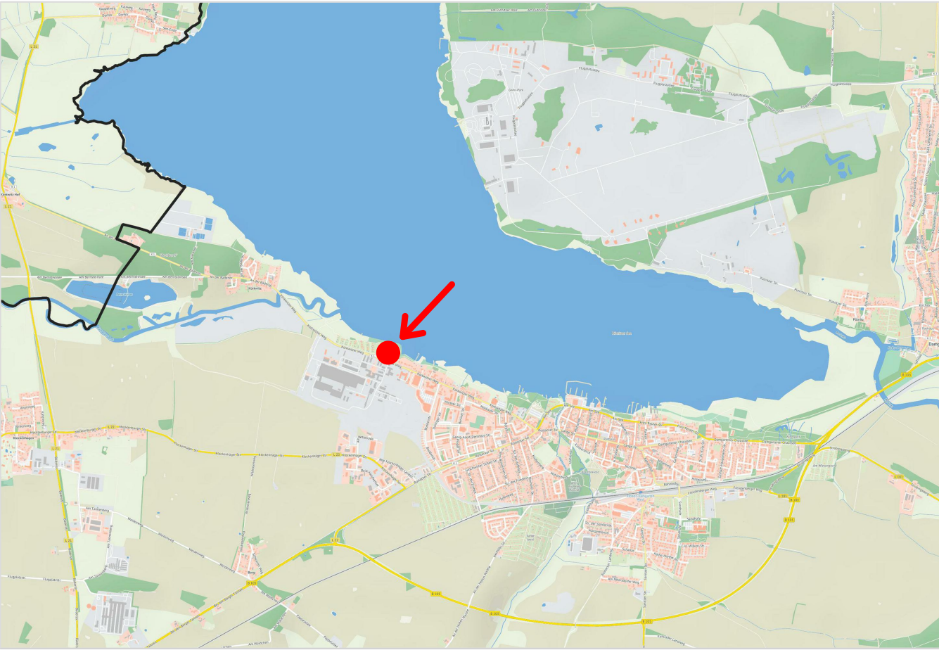
Übersichtsplan: Offene Regionalkarte M-V, unmaßstäblich

Grenze des räumlichen Geltungsbereiches der VI. Änderung der 3. Neubekanntmachung des Flächennutzungsplanes