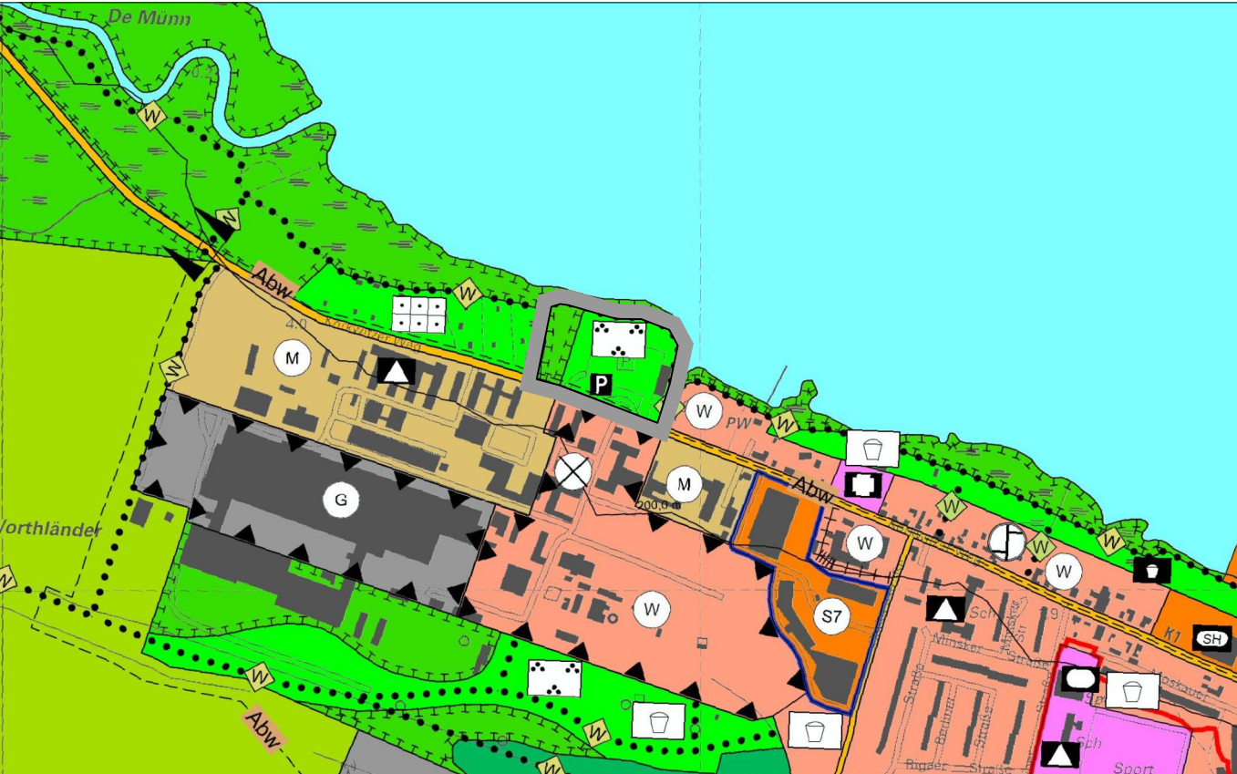
Auszug aus dem rechtswirksamen Flächennutzungsplan in der Fassung der 3. Neubekanntmachung