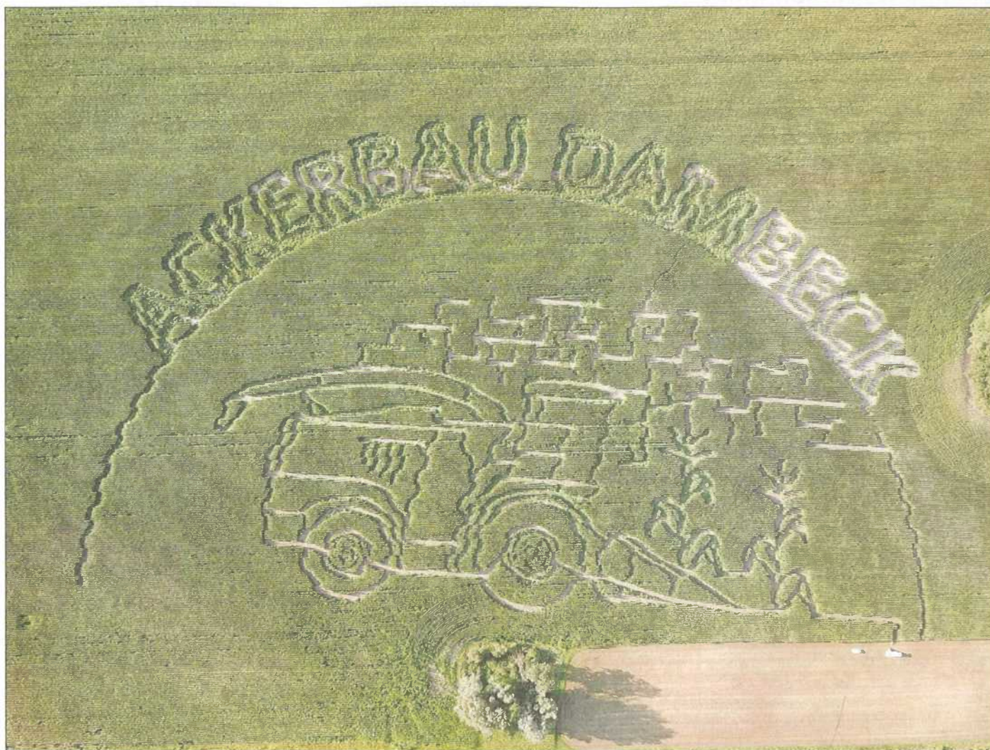
Diesjähriges Maislabyrinth in Dambeck.