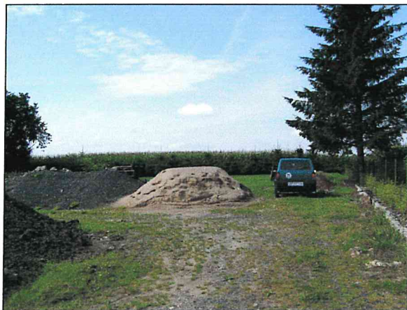
Ansicht ÄNDERUNGSFLÄCHE 1 – Flurstück 4/8- 4/9 – von der Landesstraße aus gesehen