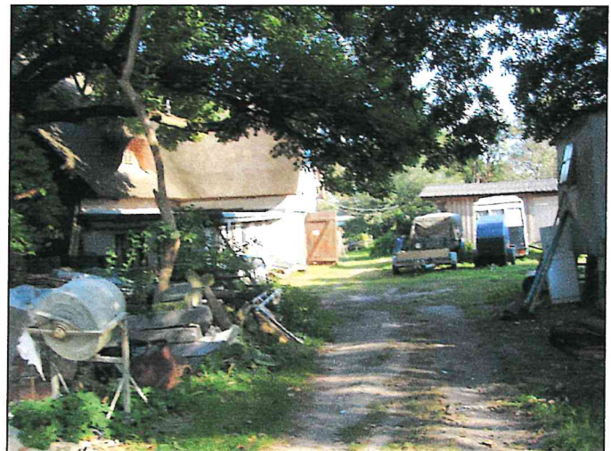
Ansicht ÄNDERUNGSFLÄCHE 2 – Flurstücke 128,129 und 52, hinterer Teil – vom Weg, Flurstück 125, aus gesehen