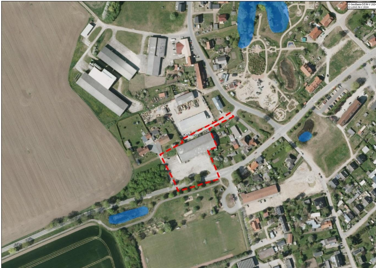
Abb. 1: Darstellung der geschützten Biotope im Umfeld (200 m) des Plangebietes gemäß der LINFOS-Datenbank, © GeoBasis DE/M-V 2024.

Im Rahmen der Aufstellung des Bebauungsplanes Nr. 29.1 wurde geprüft, ob mit der Umsetzung der Planung unzulässige Maßnahmen gemäß § 20 NatSchAG M-V eintreten können. Gemäß § 20 NatSchAG M-V sind Maßnahmen, die zu einer Zerstörung, Beschädigung, Veränderung des charakteristischen Zustandes oder sonstigen erheblichen oder nachhaltigen Beeinträchtigungen von gesetzlich geschützten Biotopen führen können, unzulässig.