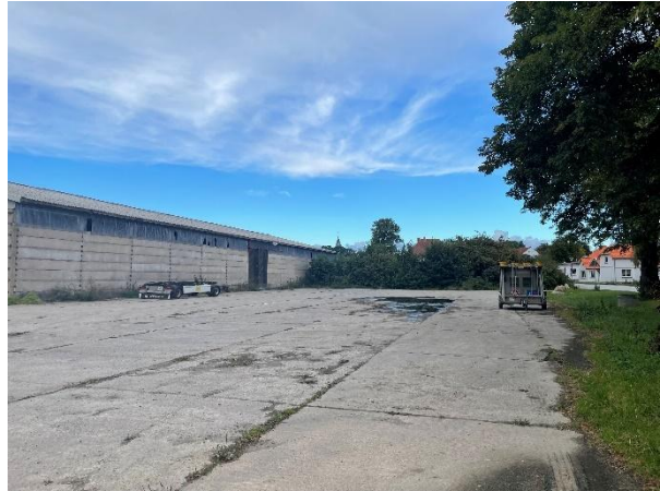
Bestehende Halle auf der für die Feuerwehr bzw. den öffentlichen Parkplatz vorgesehenen Fläche