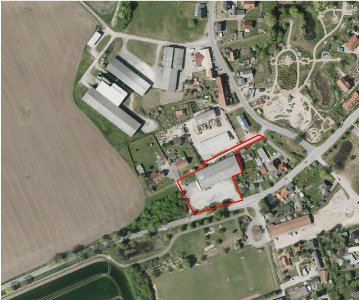
Luftbild des Plangebietes in Kalkhorst