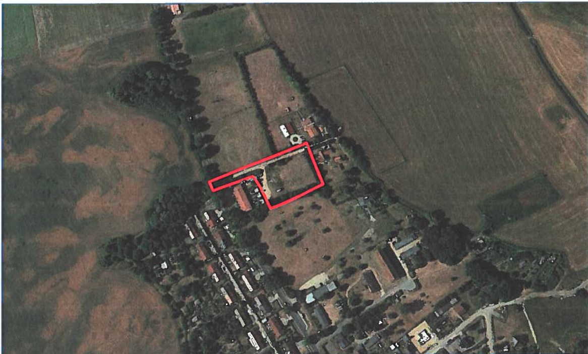
Abb. 13 Luftbild des Untersuchungsgebietes.