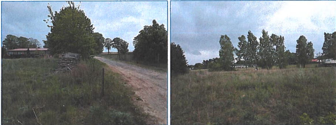
Abb. 11 und 12 Gehölze entlang der bestehenden Zuwegung und Blick über die Ruderalfläche.