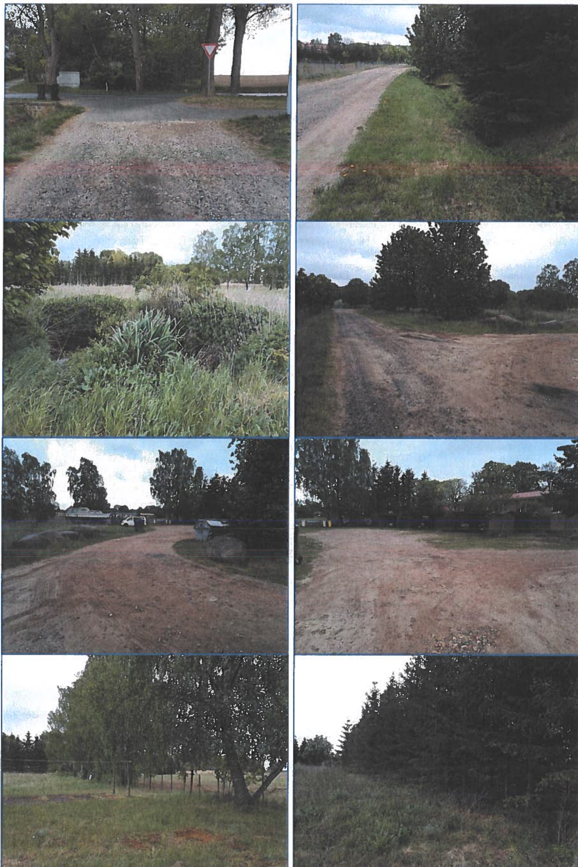
Abb. 3 bis 10 Bestehende Zuwegung mit Sickergraben und Sickerschacht, sowie Gehölze und Bebauung an den Rändern des Plangebietes.