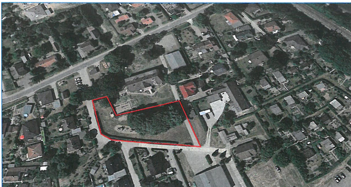
Abb. 2 Luftbild Bereich der 2. Änd. Bebauungsplan Nr. 101 - ALTES DORF - der Gemeinde Wackerow