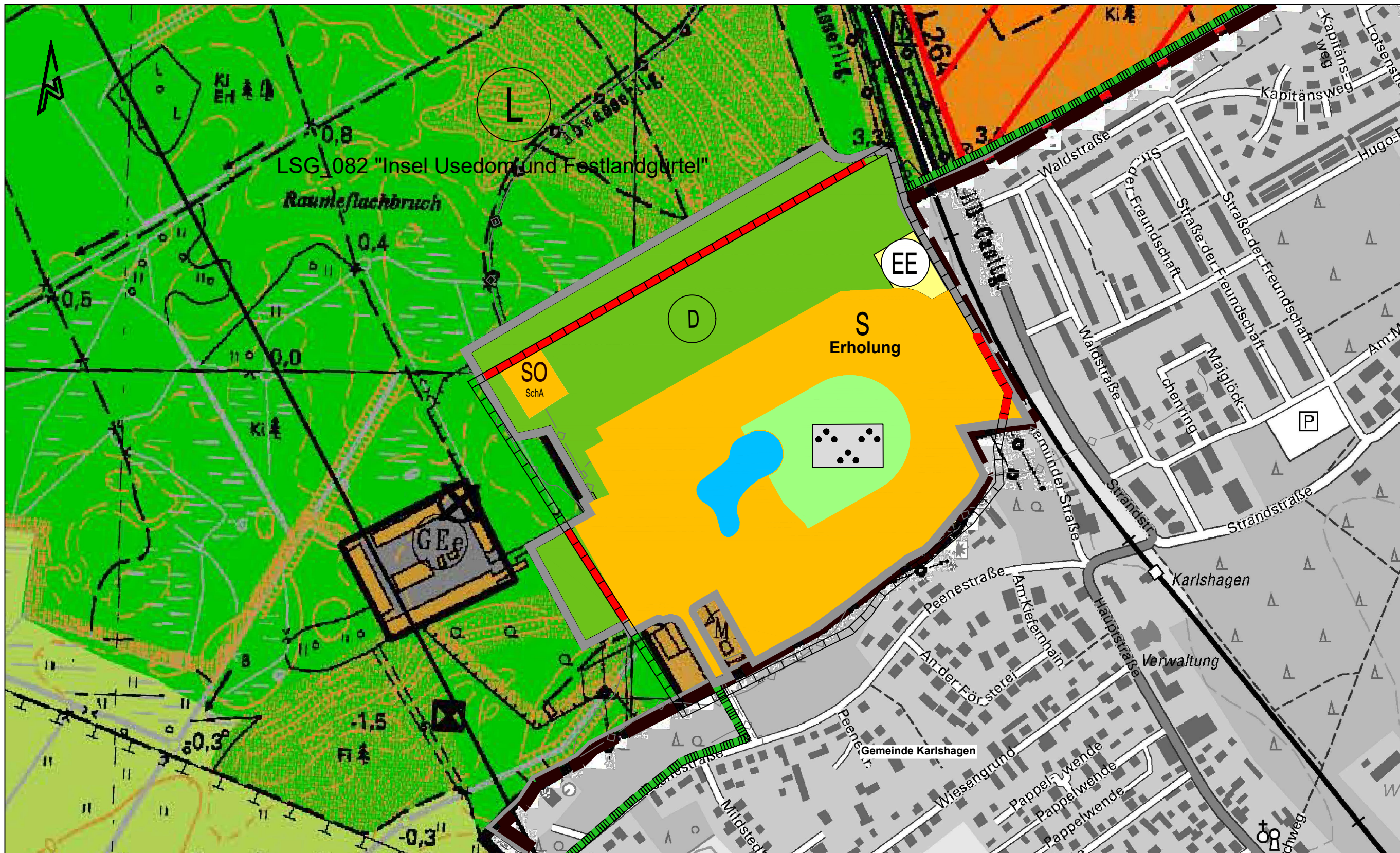
Plangrundlage: Flächennutzungsplan Gemeinde Peenemünde, LAIV - Topographische Karte DTK10 © GeoBasis-DE/M-V, EPSG: 2399

i.V.m. Bebauungsplanes Nr.10 "Gesundheitspark Peenemünde-Karlshagen an der Alten Peenemünder Straße" Planzeichnung