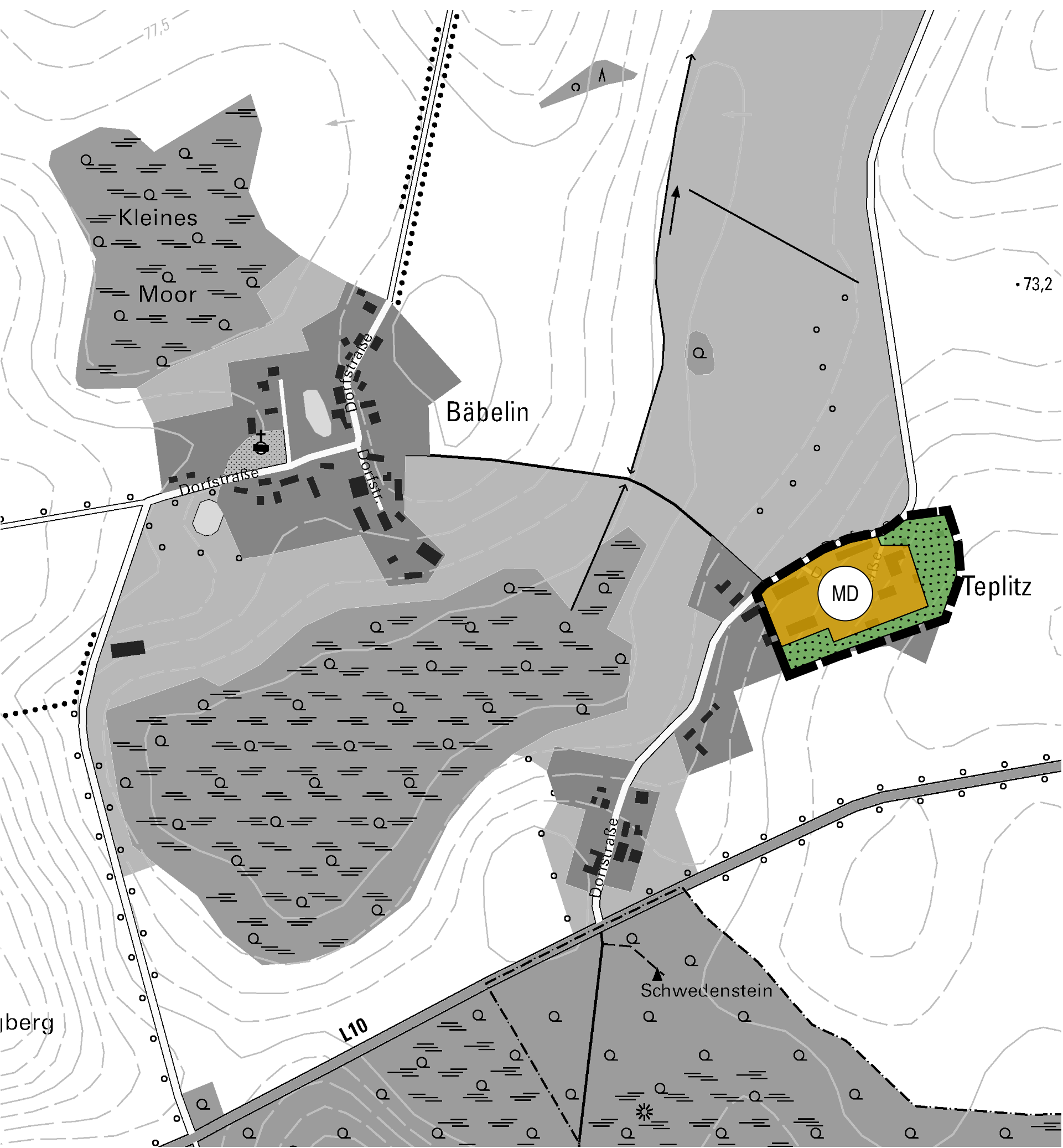
1. Änderung des Flächennutzungsplanes Dörfergebiete, Grünflächen

Geltungsbereich der 1. Änderung des Flächennutzungsplanes