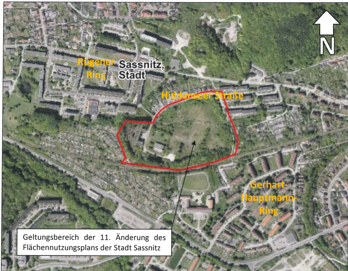
Kartengrundlage: Orthofoto (Darstellung ohne Maßstab)

Der Geltungsbereich der in Aufstellung befindlichen 11. Änderung des Flächennutzungsplans ist nachstehend zeichnerisch dargestellt: