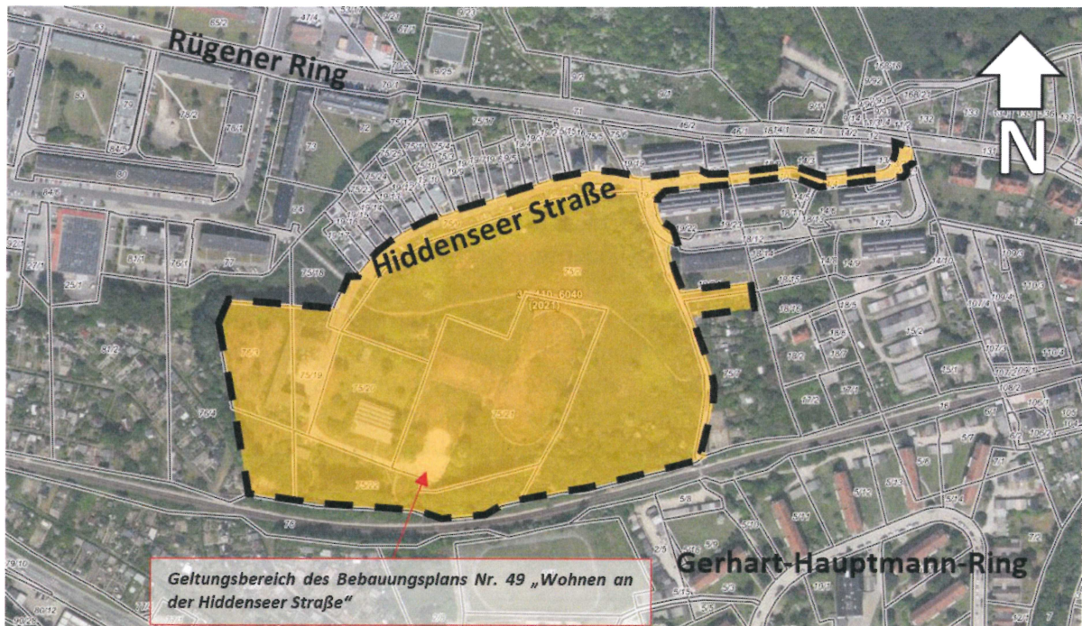
Kartengrundlage: Geodatenportal des Landkreises Vorpommern-Rügen / Darstellung ohne Maßstab

Im sich daran anschließenden Verfahren wurde der Geltungsbereich dann um die öffentliche Verkehrsfläche der oberen Lenzer Straße (siehe näherungsweise Kennzeichnung durch einen roten Kreis in der nachstehenden Zeichnung) erweitert. Gleichzeitig wurde der Geltungsbereich südlich des Wohngebäudes Lenzer Straße 1-3 zeichnerisch korrigiert (siehe näherungsweise Kennzeichnung durch einen blauen Kreis in der nachstehenden Zeichnung).