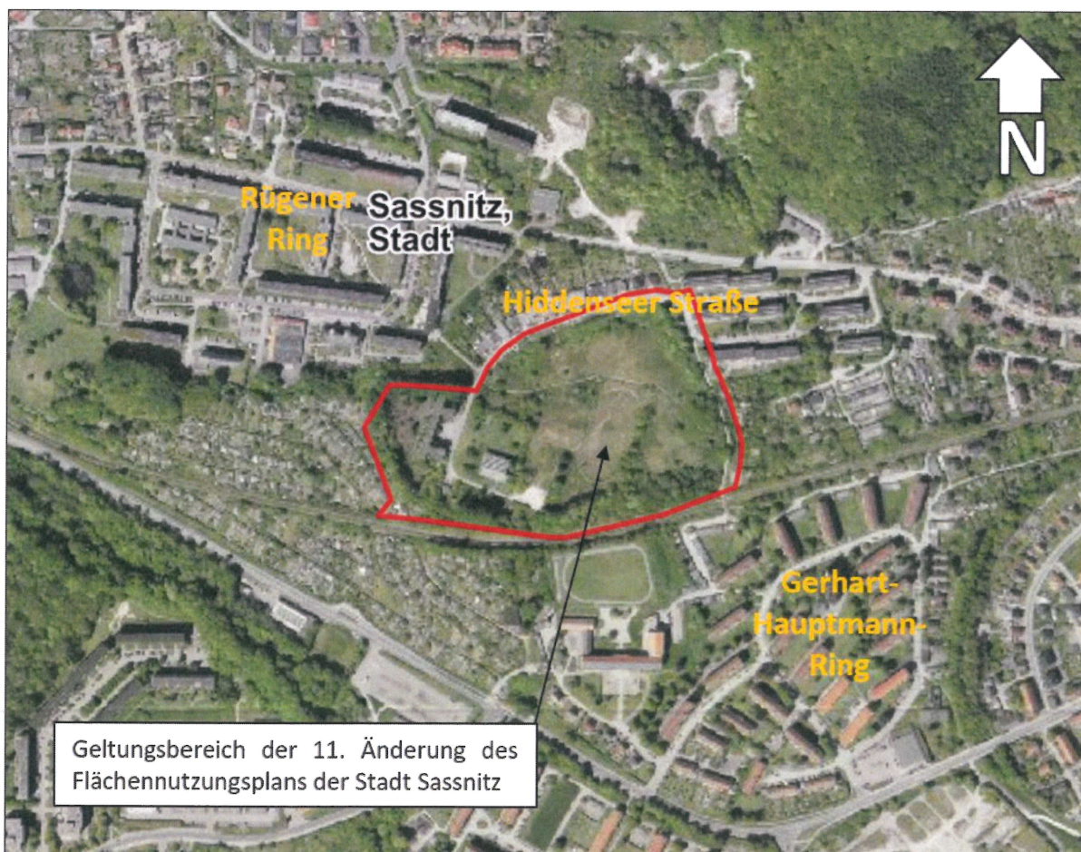
Kartengrundlage: Orthofoto (Darstellung ohne Maßstab)