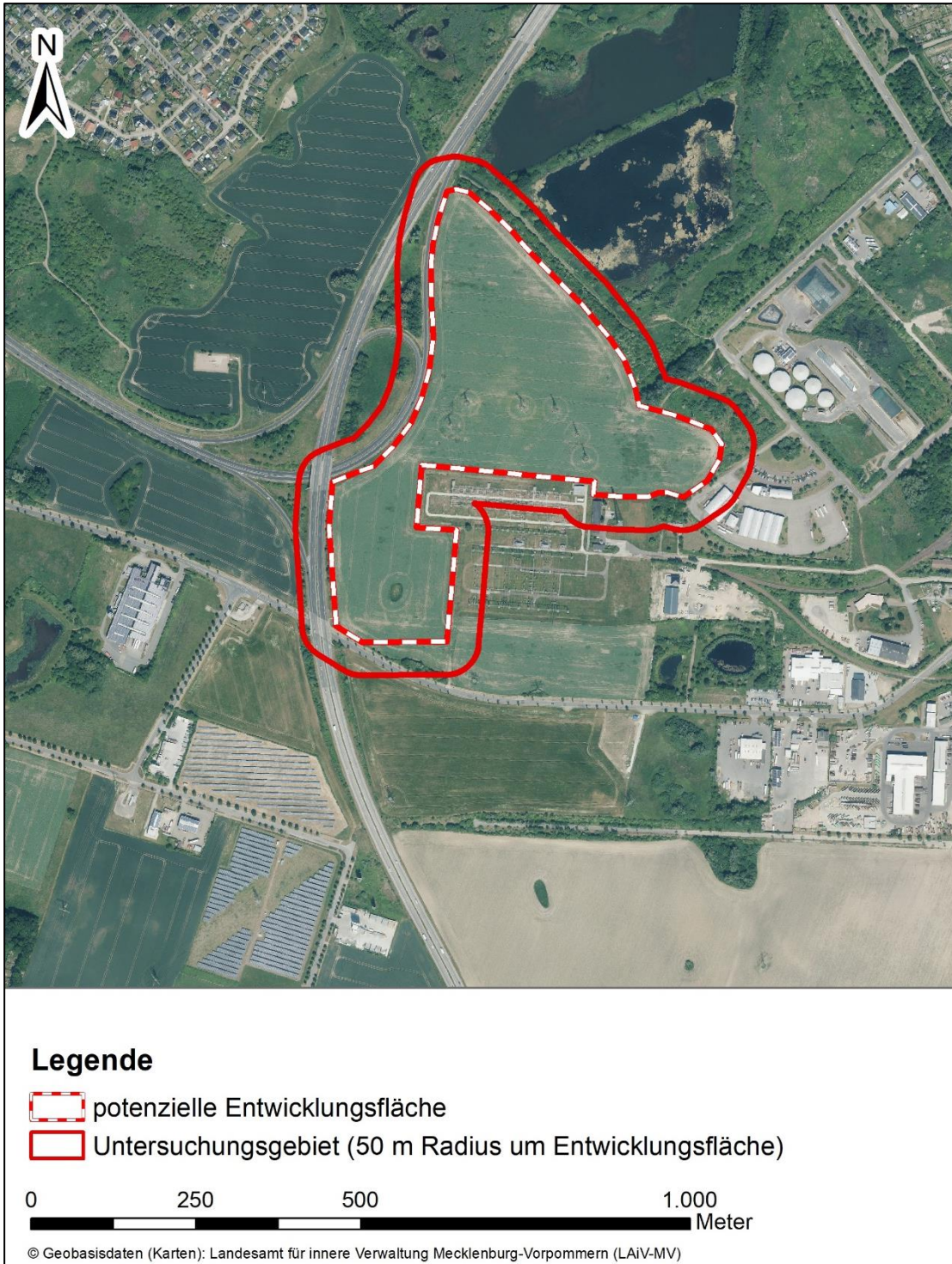
Abbildung 1 Übersichtskarte zur Lage des Untersuchungsgebiet