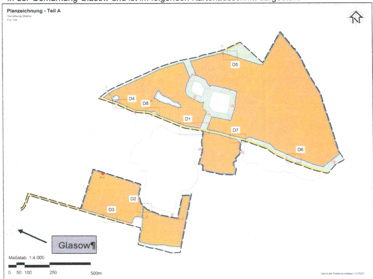
Abbildung 1: Vorhabengebiet - vorhabenbezogener Bebauungsplan Nr.1 "Solarpark Randow-Plateau" der Gemeinde Glasow

Der Geltungsbereich des vorhabenbezogenen Bebauungsplans Nr. 1 „Solarpark Randow-Plateau“ der Gemeinde Glasow umfasst eine Fläche von ca. 82,5 ha auf den Flurstücken 44, 45 (tlw), 46 (tlw), 48 (tlw), 6, 7, 8, 9, 10, 11, 12, 13, 14, 3, 5 und 20 (tlw) der Flur 104 in der Gemarkung Glasow und ist im folgenden Kartenausschnitt dargestellt: