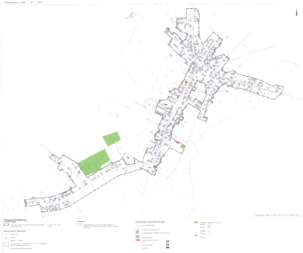
1. Änderung der Klarstellungs- und Abrundungssatzung Boock der Gemeinde Boock Planzeichnung (Teil A) M 1 : 2.000

Sämtliche andere Einfriedungen sind bis zu einer maximalen Höhe von 1,80m zulässig.