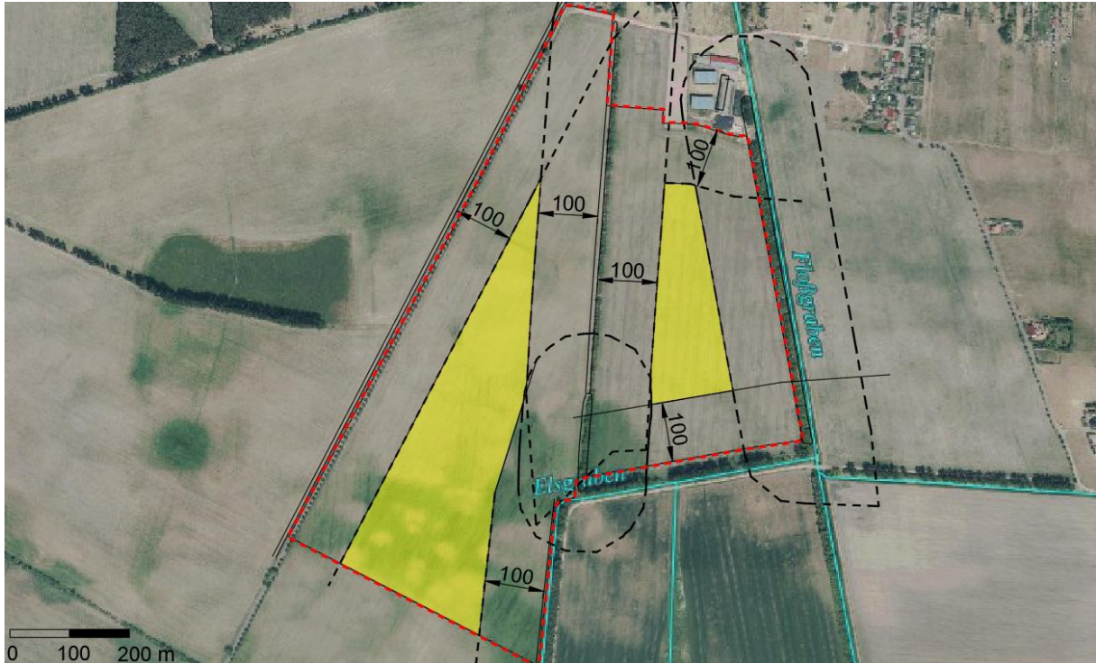
Abb. 3: Meideverhalten Feldlerche (GeoBasis-DE/M-V 2023)

Der Flächenbedarf für die Feldlerche wird multifunktional durch die Anlag von Extensivgrünland innerhalb und außerhalb des Plangebietes kompensiert.