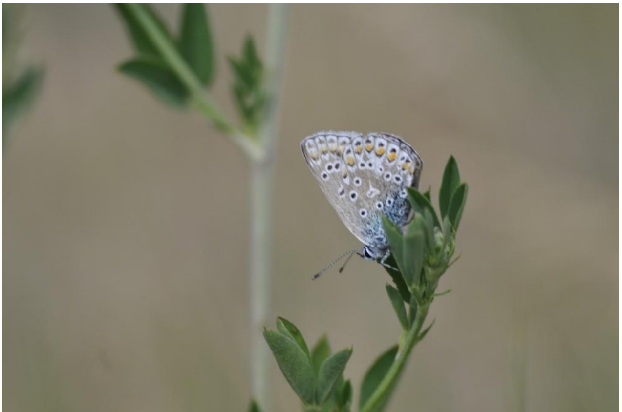
Abbildung 3: Hauhechel-Bläuling im Untersuchungsgebiet ( Polyommatus icarus )