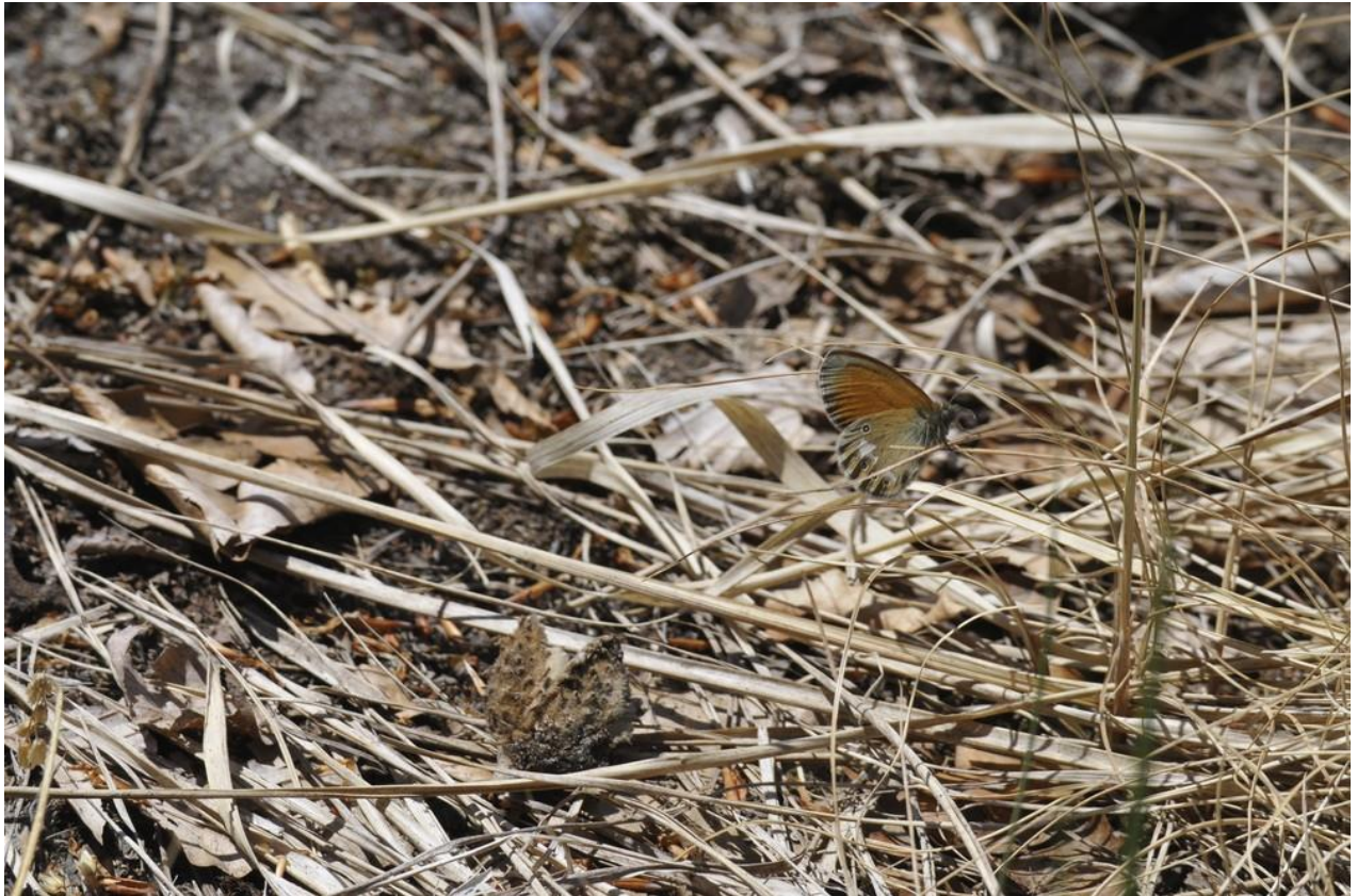
Abbildung 4: Rostbraunes Wiesenvögelchen im Untersuchungsgebiet ( Coenonympha glycerion )