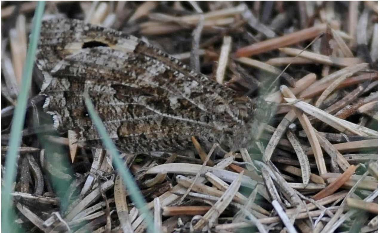
Abbildung 2: Ockerbindiger Samtfalter im Untersuchungsgebiet ( Hipparchia semele )