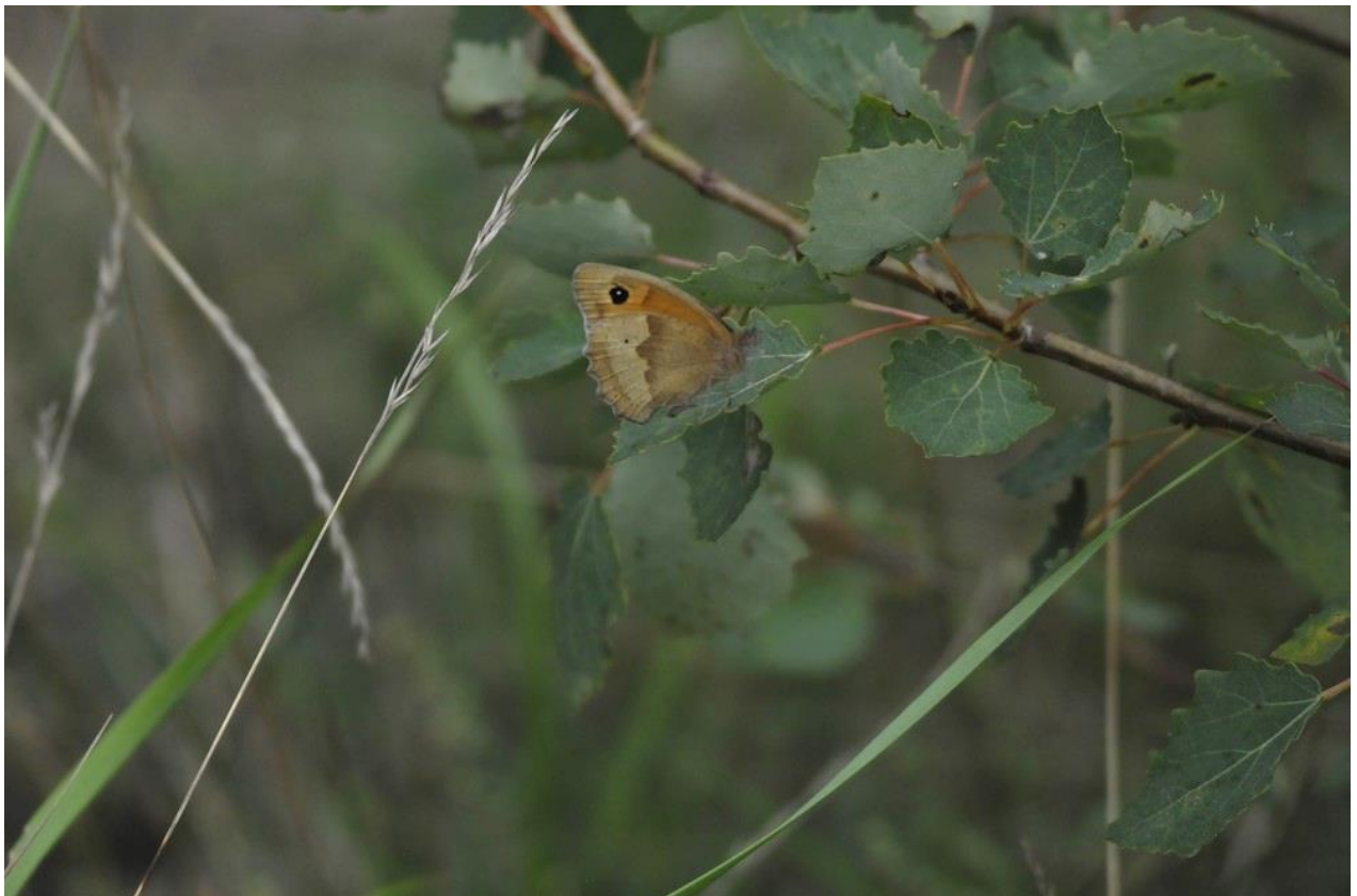
Abbildung 5: Großes Ochsenauge im Untersuchungsgebiet ( Maniola jurtina )