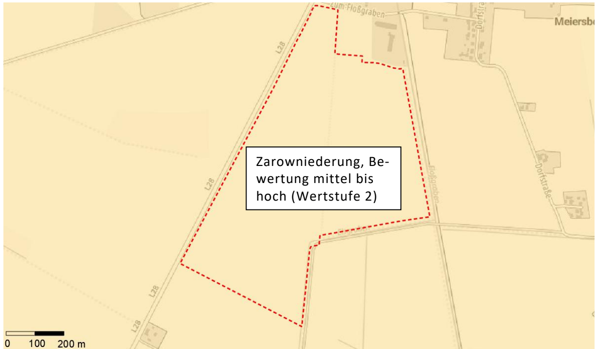
Abb. 2: Landschaftsbildraum (GeoBasis-DE/M-V 2023)

Dem Kompensationserlass ist Folgendes zu entnehmen: „Liegt der Vorhabenbereich auf der Grenze mehrerer Räume gilt jener mit dem höchsten flächigen Anteil“.